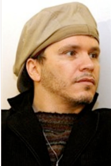
Olivier Dahan. Réalisateur