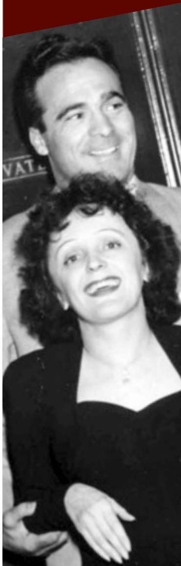
Edith Piaf avec Marcel Cerdan